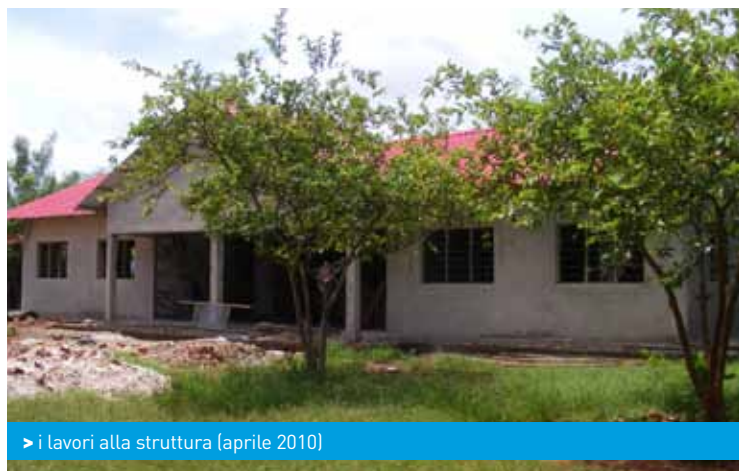
> i lavori alla struttura (aprile 2010)