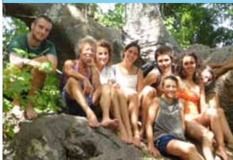
primo campo giugno/luglio

Sono stati 36 i volontari che hanno partecipato alle diverse attività negli asili di Kikadini, Mwendawima, Uzi, Unguja Ukuu, Kibuteini e Charawe.