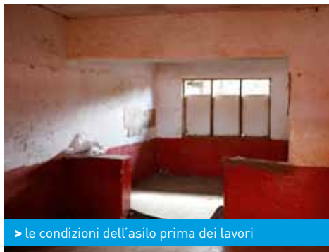
> le condizioni dell'asilo prima dei lavori

Le condizioni davvero pessime della struttura (i muri di mattoni di fango, il tetto in eternit, gli infissi e i serramenti oramai rovinati, la disposizione dei muri interni di una struttura nata come abitazione e solo successivamente adibita ad asilo) non hanno permesso di recuperare un gran che, ma le fondamenta ancora in buono stato e i muri perimetrali hanno dato