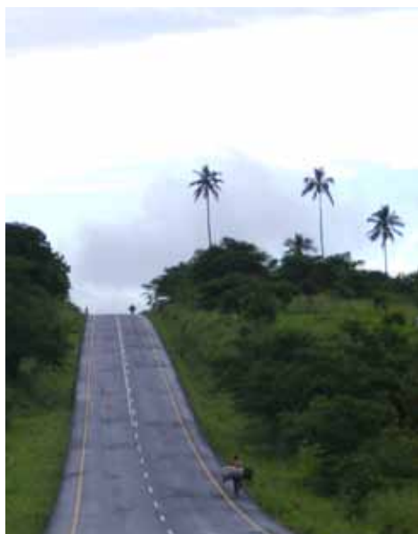
>> La strada per Arusha

E poi c'è Agheni, intelligentissima, sveglia, la più brava della scuola, su una sedia a rotelle, senza possibilità di recupero a causa di una tubercolosi non riconosciuta e non curata.