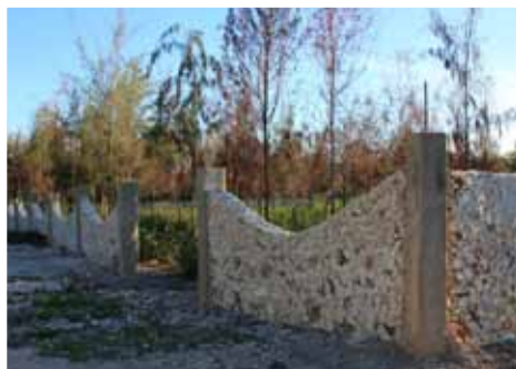
>> La terra acquistata a Jambiani

È vero, già in diversi "Diari" abbiamo parlato di questo argomento. Ma è importante comprendere che un'opera del genere, tanto complessa e partecipata, prenda forma