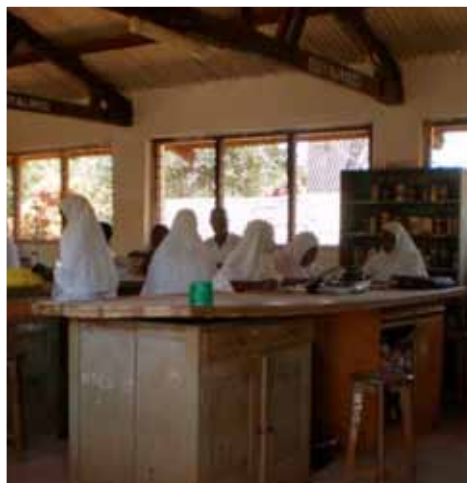
>> Il vecchio laboratorio

ne col conseguente degrado delle strutture. Per questo lo scorso anno abbiamo accettato di impegnarci a ristrutturare tutti gli edifici del centro, rendendoli agibili e sicuri per