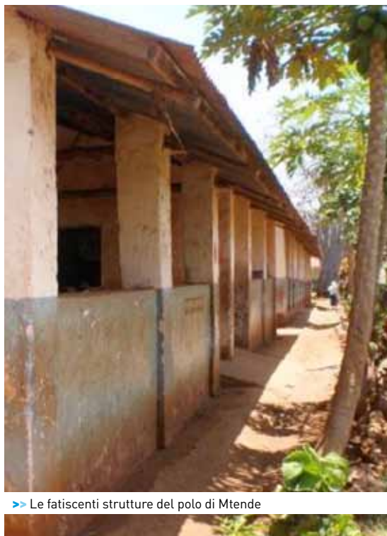
>> Le fatiscenti strutture del polo di Mtende

Il polo scolastico di Mtende è un complesso di edifici che ospitano la scuola primaria e secondaria. Gli edifici sono tutti in cattive condizioni, sia di manutenzione che strutturali, ma la bellezza del luogo è incredibile, ci si ritrova in mezzo alla vegetazione e fra i vari edifici dove sono ospitate le aule ci sono interi spazi dedicati alle varie colture ortive. Mi è sempre piaciuto vedere che si coltiva l'orto giusto al di fuori delle aule scolastiche! Il progetto di Mtende prevede la ristrutturazione di tutti gli edifici scolastici e dell'ufficio insegnanti, dove oltre ad esserci la biblioteca della scuola, verrà anche strutturate una sala computer.